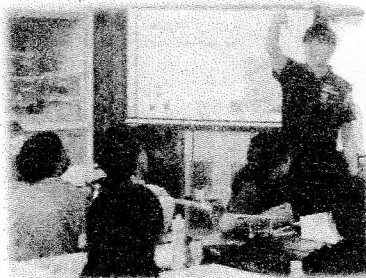
実験が楽しかった理科の授業