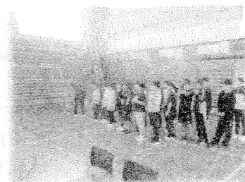
ステージバック絵の説明を聞く6年生

最後に、小学生と中学生と一緒に出身校の校歌を歌いました。小中合同で歌い、お互いの小学校の校歌を聴き合う等、小中や小小の交流を深めました。今回は、バス1台を手配し、2つの小学校の児童を順に登校させる等の工夫を図り、移動時間の短縮も図りました。昨年度の取組を改善し、より相乗的・補完的な効果を高めていました。