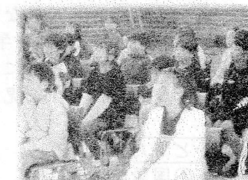
素敵なハーモニーに聴き入る6年生

○小学校の行事とは違う中学校の行事の内容等を知り、改めて中学生は小学生よりもレベルが高いなと感じました。学年合唱の迫力がすごくて、私も挑戦してみたいなと思いました。