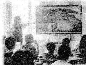
スライドを作成する社会科の授業