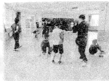
小中合同で学習した体育科の授業

○兄から「中学校は厳しい！」と言われていましたが、先生は優しく、大休みがない等、生活面では変わるところもあるけど、新しい環境の中での生活や部活動が楽しみになりました。