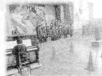
練習の成果を存分に発揮する中学生