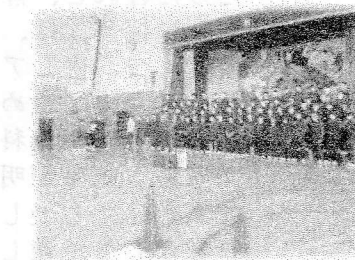
圧倒的な歌声の学年合唱