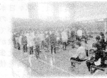
小学校の校歌の交流